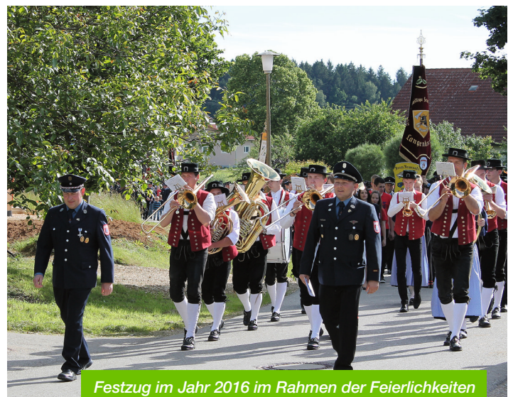
Festzug im Jahr 2016 im Rahmen der Feierlichkeiten zum 90-jährigen Bestehen der FF Langenkreith.