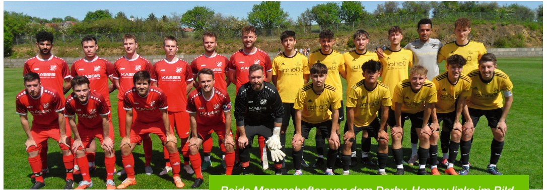
Beide Mannschaften vor dem Derby, Hemau links im Bild.

Das Großgemeindederby zwischen der SG Hohenschambach und dem TV Hemau endete mit einem 3:0-Erfolg für die Platzherren. Dadurch stehen die Hohenschambacher nach dem vorletzten Spieltag der Saison 2025/26 in der Kreisliga 2 auf Rang 5 mit 41 Punkten, während Hemau als Tabellenletzter mit 16 Punkten als direkter Absteiger in die Kreisklasse zurück muss.