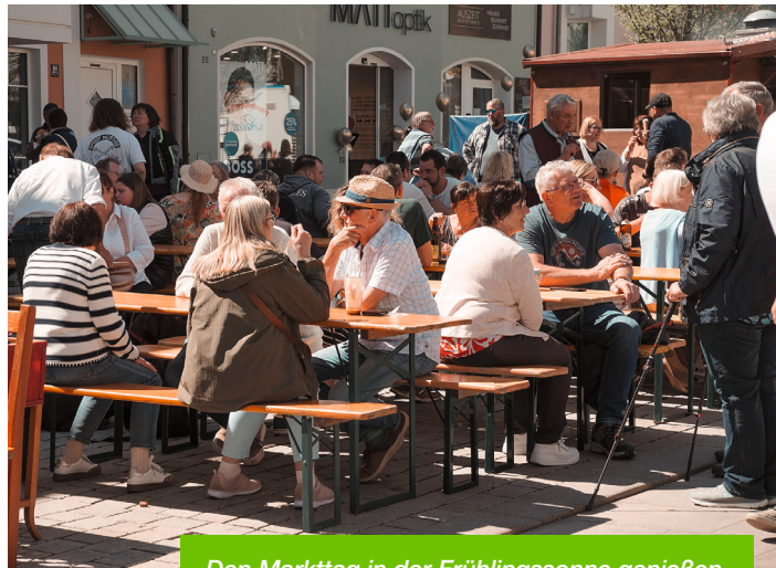
Den Markttag in der Frühlingssonne genießen.

Besser hätten die Bedingungen kaum sein können: Bei strahlendem Sonnenschein und frühlingshaften Temperaturen verwandelte sich Hemau am 26. April in eine lebendige Marktlandschaft. Der Frühlingsmarkt, organisiert vom Fachgeschäftskreis Hemau in Zusammenarbeit mit der Stadt Hemau, lockte zahlreiche Besucherinnen und Besucher an und sorgte den ganzen Tag über für eine rundum positive und einladende Atmosphäre.