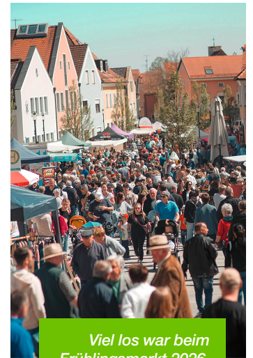
Viel los war beim Frühlingsmarkt 2026.