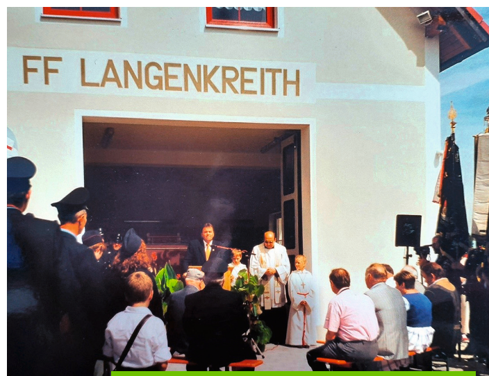
Einweihung des Feuerwehrhauses im Jahr 2001.

Am 21. November 1926 haben sich engagierte Bürger der damaligen Gemeinde Langenkreith zur Neugründung einer Freiwilligen Feuerwehr getroffen. Das war der Beginn einer 100-jährigen Erfolgsgeschichte: nicht nur, weil man in vielen Einsätzen in Not geratenen Menschen helfen oder Hab und Gut vor dem Feuer retten konnte, sondern auch, weil der Verein über zehn Jahrzehnte hinweg einen erheblichen Teil zu einer lebendigen Dorfgemeinschaft beigetragen hat.