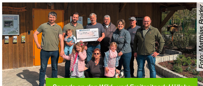
Spende an den Wild- und Freizeitpark Höllohe