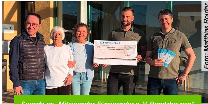
Spende an „Miteinander-Füreinander e. V. Beratzhausen“