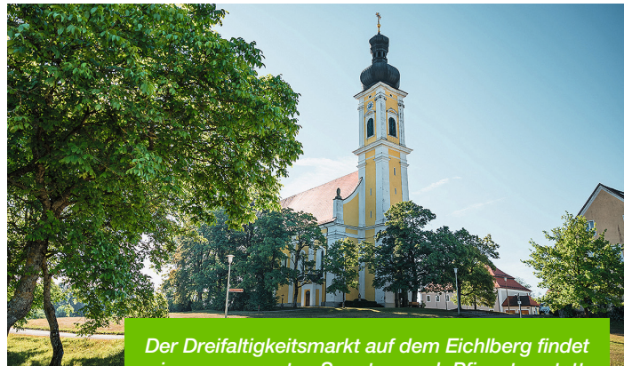
Der Dreifaltigkeitsmarkt auf dem Eichlberg findet immer am ersten Sonntag nach Pfingsten statt.

Rings um die Kirche mit dem markanten Zwiebelturm verteilen sich etwa 60 Marktstände. Das vielfältige Sortiment reicht von Kleidung, Haushalts- und Lederwaren über Spielzeug und Dekora-