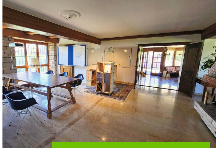
In der Grunwald-Villa stehen verschiedene Arbeitsbereiche für Coworking zur Verfügung.

Das Projekt ist Teil der Initiative „Sorgende Stadt Hemau“ und richtet sich grundsätz-