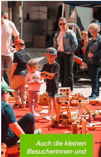
Auch die kleinen Besucherinnen und Besucher kamen auf ihre Kosten.

Schon am Vormittag füllten sich die Straßen und schnell wurde deutlich: In Hemau ist