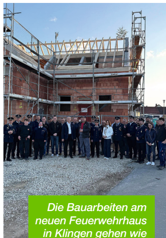
Die Bauarbeiten am neuen Feuerwehrhaus in Klingingen gehen wie geplant voran.

Der Neubau des Gerätehauses wurde nötig, weil das bisherige Feuerwehrhaus aus dem Jahr 1983 den heu-