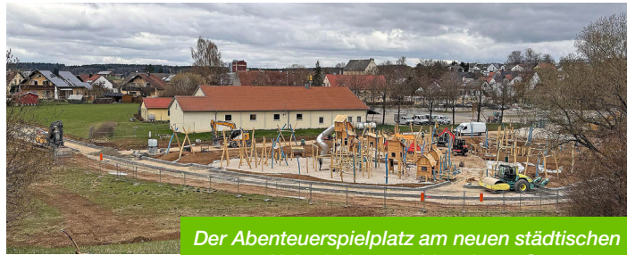
Der Abenteuerspielplatz am neuen städtischen Naherholungsgebiet nimmt Gestalt an.

Zwischen Volksfestplatz und Waldfriedhof entsteht in den kommenden Jahren das neue städtische Naherholungsgebiet – ein grüner Erholungsraum für alle Generationen mit Ruhezonen und Actionflächen. Im ersten Bauabschnitt wird derzeit auf rund 3.200 Quadratmetern ein Abenteuerspielplatz errichtet. Die rund 35 Spielgeräte wurden bereits angeliefert und werden