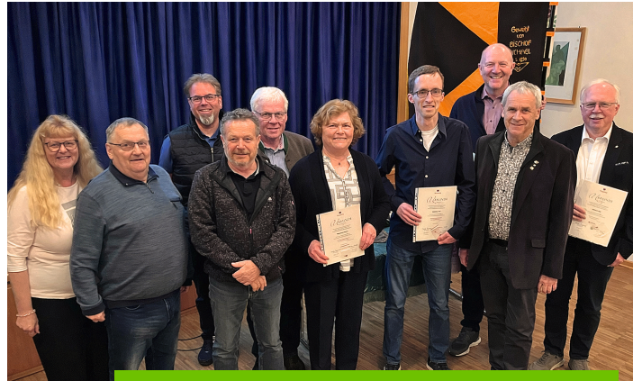
Die geehrten Mitglieder der Kolpingsfamilie Hemau.

In ihrem Jahresbericht ging Eibl auf die vielfältigen Aktivitäten der Kolpingsfamilie ein. Aktuell zählt der Verein 165 Mitglieder. Die Arbeit wird von elf Vorstandsmit-