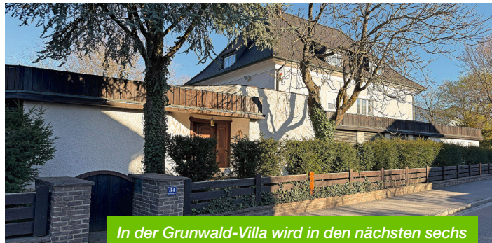
In der Grunwald-Villa wird in den nächsten sechs Monaten ein neues Nutzungskonzept erprobt.

Außerhalb der Coworking-Zeiten, also insbesondere abends und an Wochenen-