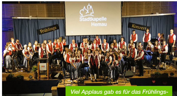
Viel Applaus gab es für das Frühlingskonzert der Stadtkapelle Hemau.