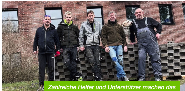
Zahlreiche Helfer und Unterstützer machen das Gartenprojekt des Blindeninstituts möglich.

Den Auftakt bildeten erste praktische Arbeiten vor Ort. So wurden Pflastersteine an-