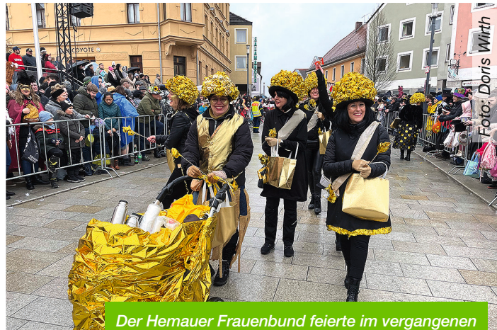
Der Hemauer Frauenbund feierte im vergangenen Jahr sein 50-jähriges (goldenes) Vereinsjubiläum.

Durch die Investition in Baumaterial für die Wagen unterstützt die Stadt Hemau die kreative Gestaltung des Faschingszugs. Im letzten Jahr wurden sage und schreibe 20.000 Meter Holzlatten, circa 410 Packungen Holzschrauben, 3 Tonnen Farbe, 2 Tonnen Pappkartonagen und 2.000 Quadratmeter Jutegebebe vom Wertstoffhof ausgegeben und verbaut.