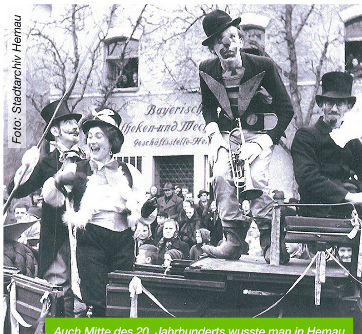
Auch Mitte des 20. Jahrhunderts wusste man in Hemau den Fasching zu feiern – wie hier beim Umzug 1951.

Die Haltestellen Hemau Volksfestplatz, Krankenhaus, Beratungshausener Straße, Stadtplatz und Förderschule in bei-